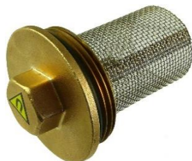
zátko s magnetom a filtračným sitkom