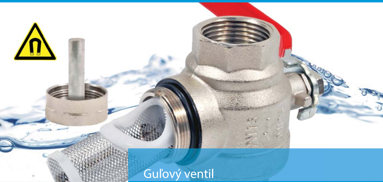
Guľový ventil s filtrom a magnetom