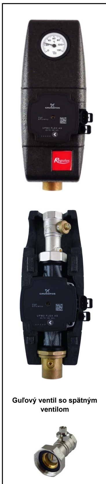
Guľový ventil so spätným ventilom