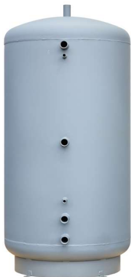
PS 1250 E+ s izoláciou