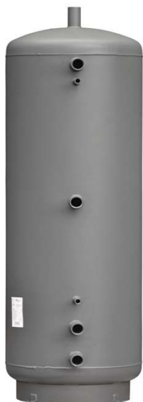
PS 500 E+ s izoláciou