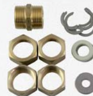
9644 (DN 16) a 9645 (DN 20)