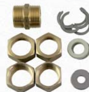
9644 (DN 16) a 9645 (DN 20)