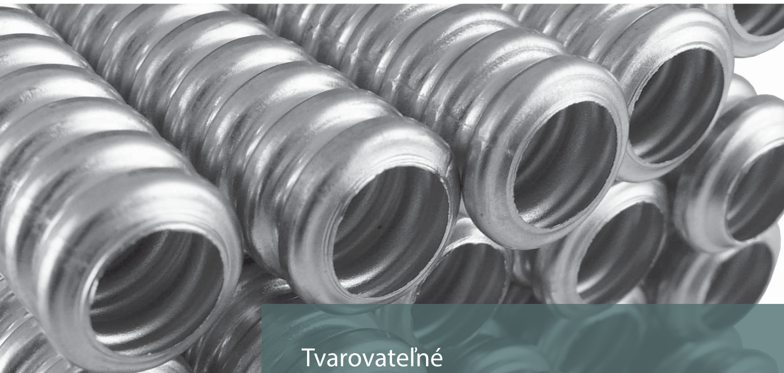
Tvarovateľné nerezové rúrky