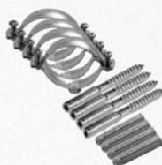
12932 (DN 16-20)