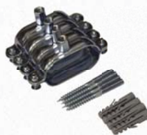
9641 (DN 16) a 9646 (DN 20)