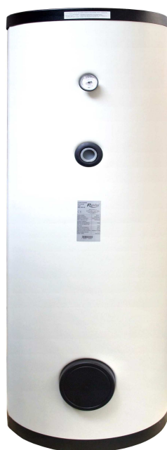
RBC 300 HP